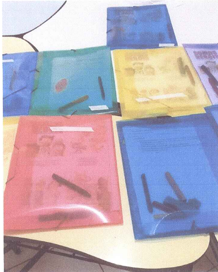
FIGURA 3 - ATIVIDADES PREPARADAS PARA SEREM ENTREGUES