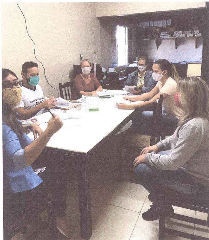
FIGURA 1 - EQUIPE REUNIDA PLANEJANDO ESTRATÉGIAS DE ATENDIMENTOS