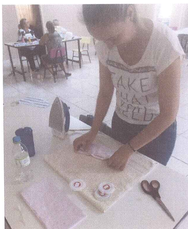
FIGURA 2 - PROFESSORA DO AEE CONFECCIONANDO MÁSCARAS PARA OS ALUNOS