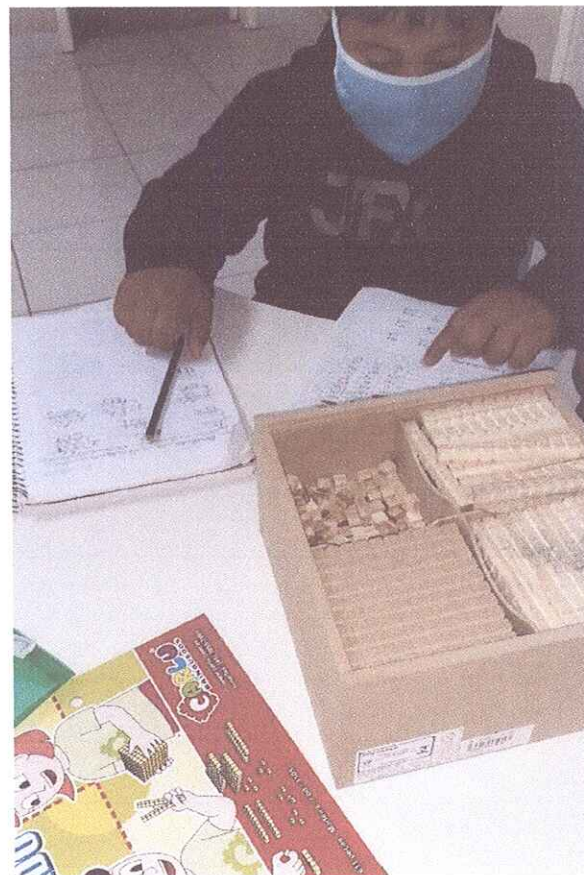
FIGURA 4 - ATENDIMENTOS PRESENCIAIS